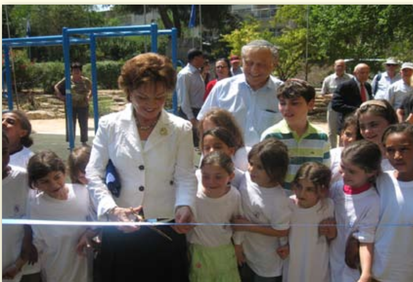
בנות כהה ב' מונו לשגרירות הגן החדש בניות.

במסגרת המיזם, נחשפו הבנות לטכניקות צילום שונות, ונגעו, בין היתר, בהיבטים שונים של סוגיית הייצוג והיחס אובייקט-סובייקט.