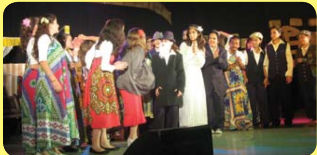
"מה קשתה, מה יפתה ומה ארכה הדרך" (מתוך שירי לאה גולדברג). עשעשנות לימוד מרתקות ומאתגרות על מחזור ל"ג הגיעו לסימון במופע מרעיש ומנהם.