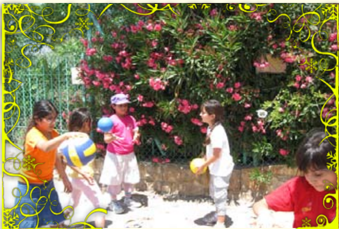
מה אומרים ההרדופים הסמוכים למגרש הספורט, עת הכדורים שורקים מעליהם? "אוי לכדור ואוי לשכנו". "לא נפרח כבר פעמיים". "הרדוף אשויג אחלק עלל".