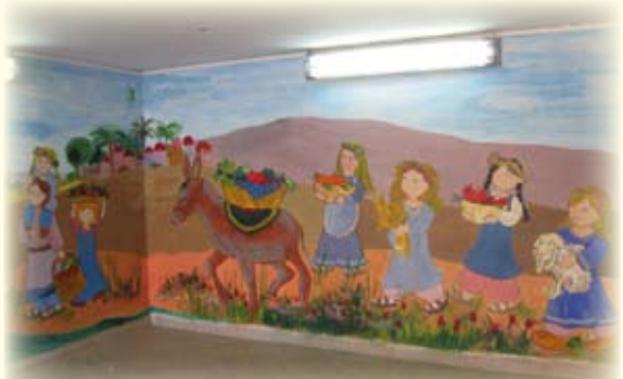
כניסת ביה"ס משנה פנים: שער כניסה מעוצב וציורי הקיר המרהיבים נוסכים אווירה נינוחה.