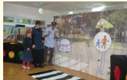
צריף ירוק, לא רחוק בית הספר...

במסגרת שבוע זה"ב, צפו בנות השכבה הצעירה בהצגה "ארץ הזה"ב", שבמהלכה נחשפו למצבים מורכבים שבהם נטלו חלק פעיל.